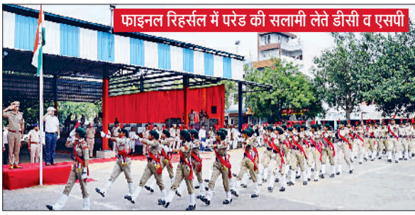
फाइनल रिहर्सल में परेड की सलामी लेते डीसी व एसपी