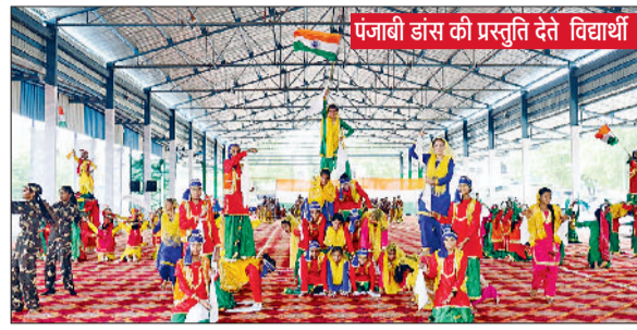
पंजाबी डांस की प्रस्तुति देते विद्यार्थी।