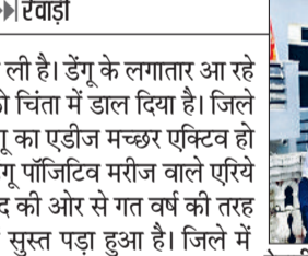
रेवाड़ी। बूढ़पुर में मिट्टी के बर्तन में लार्वा की जांच करता स्वास्थ्यकर्मी।