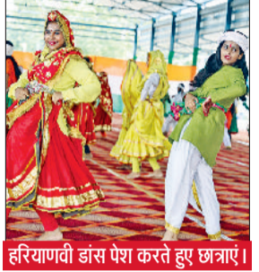
हरियाणवी डांस पेश करते हुए छात्राएं।

उन्होंने कहा कि स्वतंत्रता दिवस एक राष्ट्रीय पर्व है तथा इस समारोह का आयोजन बड़े ही गरिमामयी ढंग से किया जा रहा है। उन्होंने कहा कि स्वतंत्रता दिवस समारोह में जिला के