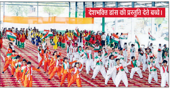
देशभक्ति डांस की प्रस्तुति देते बच्चे।