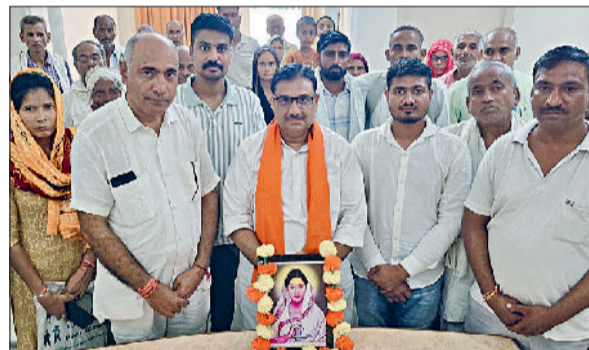
रेवाड़ी। अहिल्याबाई होल्कर को श्रद्धांजलि अर्पित करते हुए।