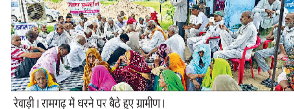
रेवाड़ी। रामगढ़ में धरने पर बैठे हुए ग्रामीण।