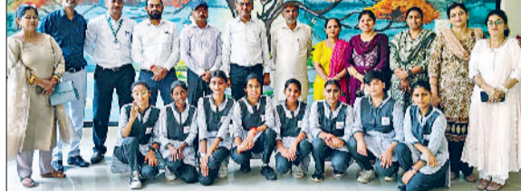
रेवाड़ी। प्रतियोगिता के विजेता शिक्षकों के साथ।