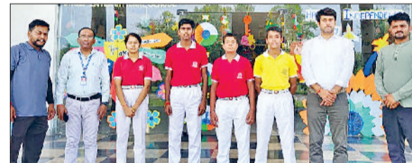
रेवाड़ी। विजेता विद्यार्थी शिक्षकों के साथ।