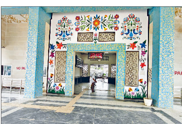
रेवाड़ी। कोसली रेलवे स्टेशन के मुख्य द्वार पर की गई सज्जा।

अमृत भारत स्टेशन योजना के अंतर्गत कोसली स्टेशन के पुनर्विकास का कार्य तीव्र गति से जारी है। प्रथम चरण के अंतर्गत स्टेशन भवन के समरूप में बड़े स्तर पर सुधार कार्य, स्टेशन की ओर आने-जाने वाले मार्ग में प्रवेश और निकास के लिए